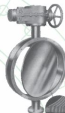
Fig. 603 / 604

3" - 24" Fig. 605 Tipo "wafer" alta pressão Serie 605 Wafer High pressure Fig. 606 com hytherm Serie 606 Wafer Hytherm seal