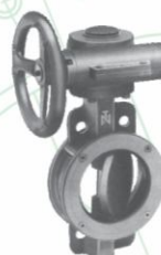
Fig. 605 / 606

3" - 20" AWWA Tipo "wafer" AWWA Wafer type